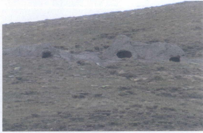
ASMA MEVKİİ KAYA ODA MEZARLARI ALAN II