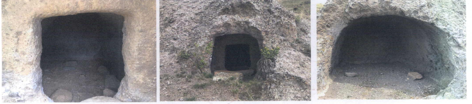
ASMA MEVKİİ KAYA ODA MEZARLARI ALAN I