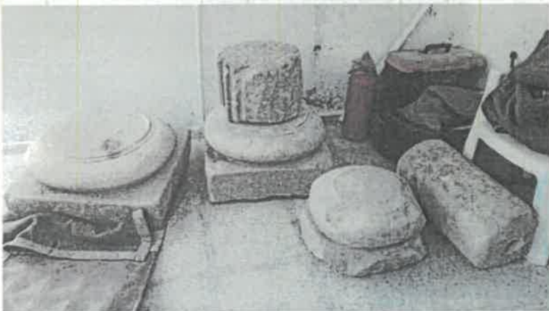
Alandan Jandarma Komutanlığına götürelerek muhafaza altına alınan mimari parçalar.