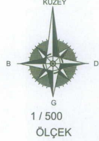
ITRF96 3 Derecelik Koordinatlar