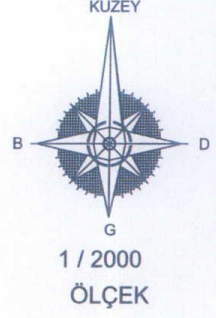
ITRF 3 Derecelik Koordinatlar