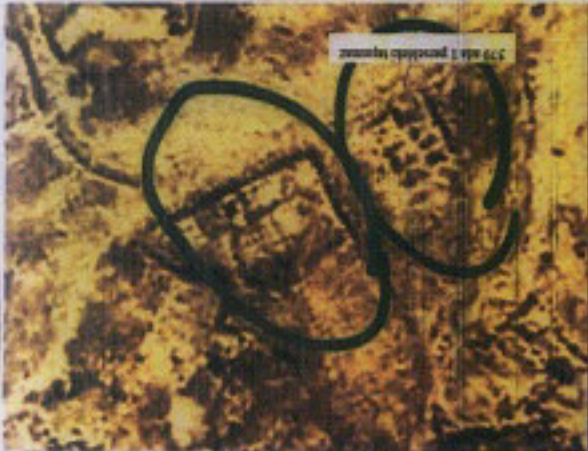
379 alla 1 provincia Agrigoro