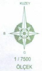
JTM ED-50 6 Derecelik Koordinatlar