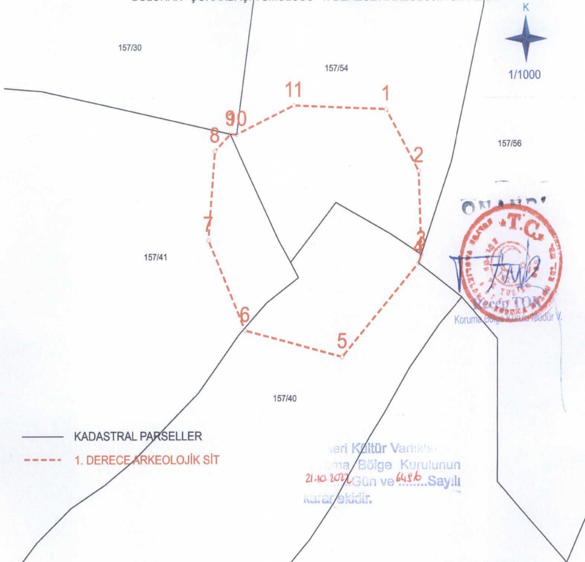
ED50 6 DERECE