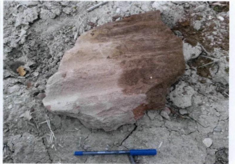
Tahıl saklama kabı Pithos'ait parça