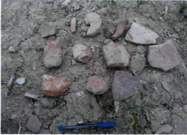
Buluntular (Tunç Dönemi)