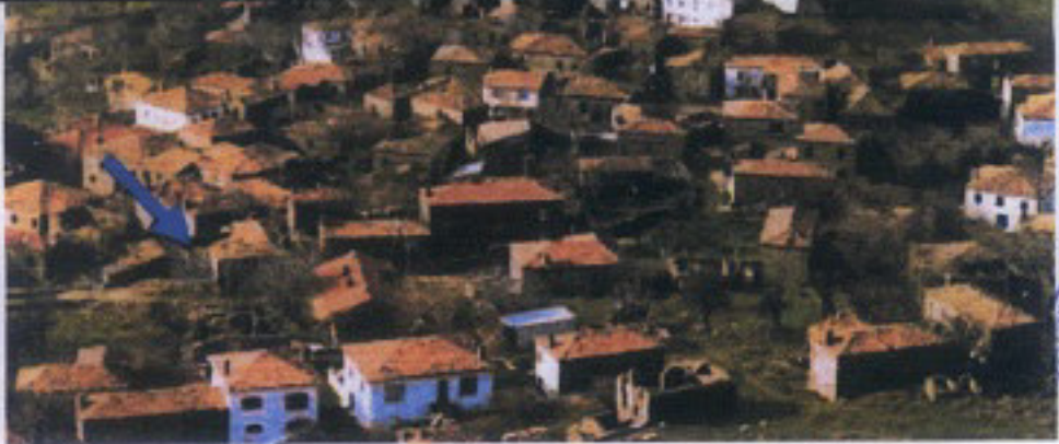
Eski Tarihli Fotograflar