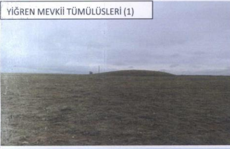
YİĞREN MEVKİİ TÜMÜLÜSLERİ (1)