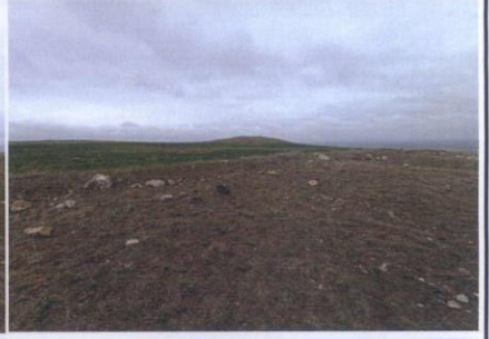
YİĞREN MEVKİİ TÜMÜLÜSLERİ (2)