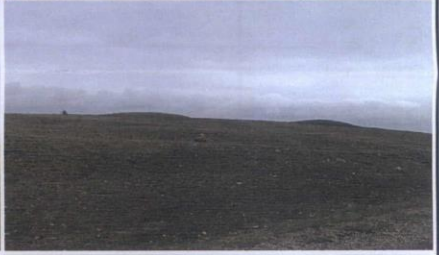
YİĞREN MEVKİİ TÜMÜLÜSLERİ (3)