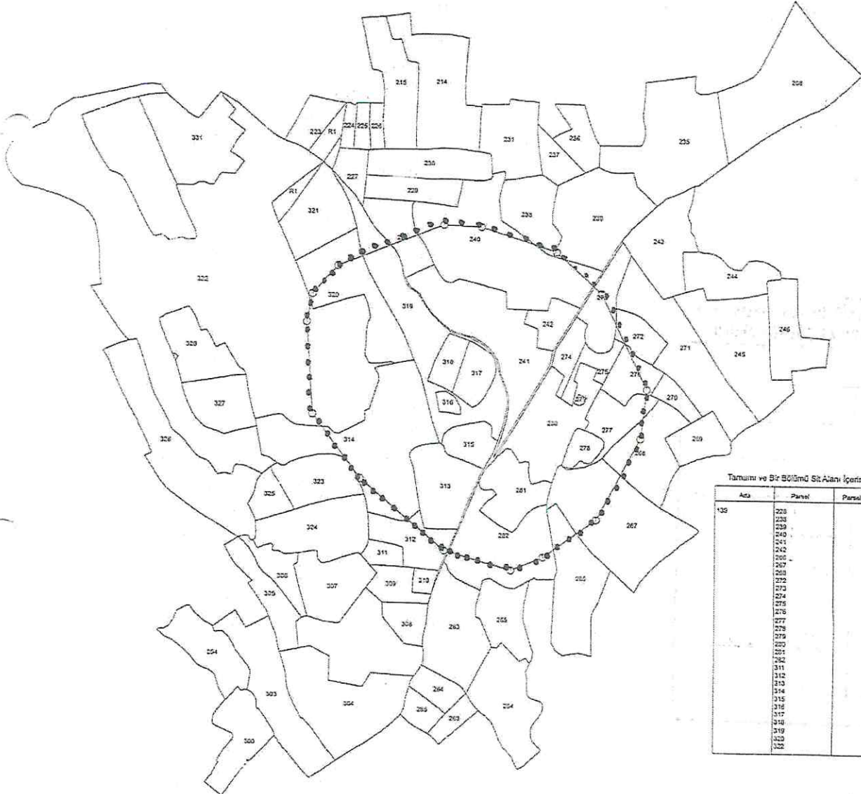
Tarımını ve Bir Bölümü Sit Alanı İçerisinde Kanan Parseller

Eskişehir Kültür Varlıklarını Koruma Bölge Kurulu Müdürlüğü 20.03.2023 tarih ve 3591312 sayılı yazısına istinaden düzenlenmiştir.