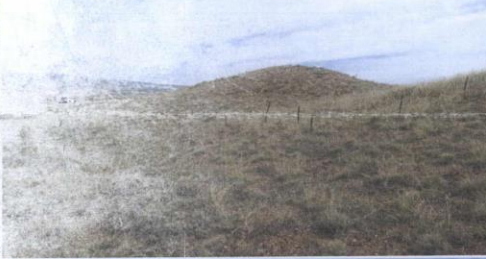
2 NOLU TÜMÜLÜSÜN GENEL GÖRÜNÜMÜ