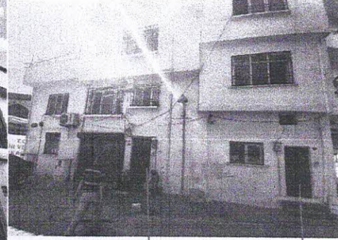
Parselin kuzeybatısındaki kütleye girişler