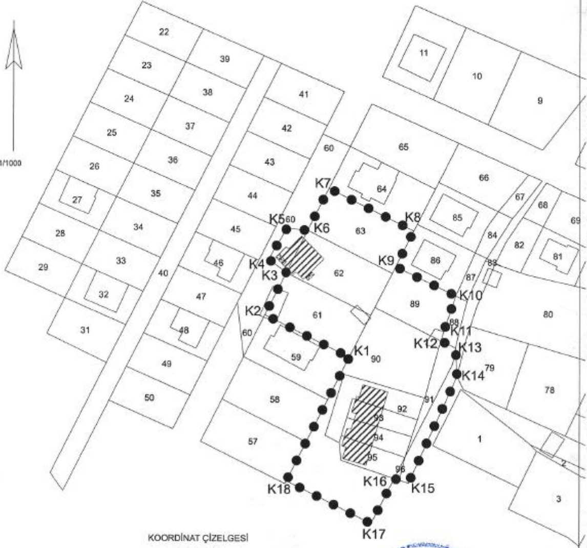
KOORDİNAT ÇİZELGESİ ITRF 3 UTM