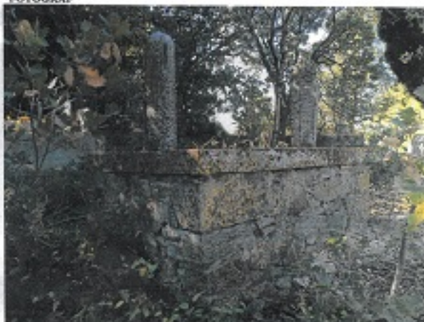
TESCİLE KONU TAŞINMAZ

GÖZLEMLER: Halk arasında Hasan Dede mezarı olarak bilinen çevresi anıtsal taş duvar ile çevrili erken devir mezar yapı alanı, 18, 19, 20 yüzyıllar Osmanlı dönemi mezar yapı ve şahitleri ile yakın dönem mezar yapılarındaki diğer mezarlık alanı bakımından eşsizdir.