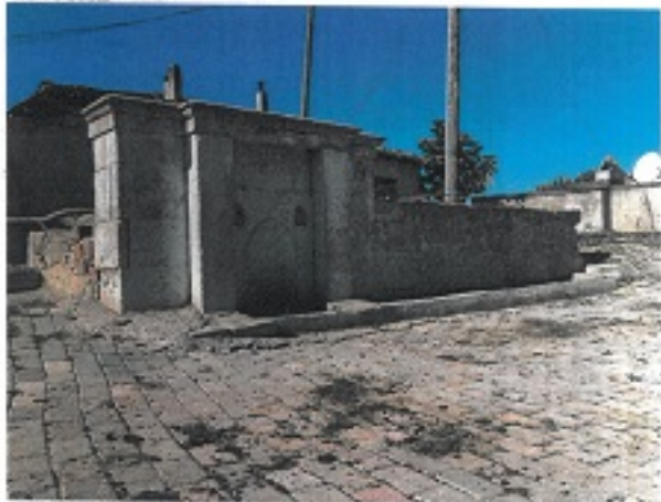
TESCİLE KONU TAŞINMAZ

GÖZLEMLER: Köy meşkin alanının batı bölümünde, düğün kesme taş malzemeden yalılık olarak yapılmış çeşme yapısıdır.