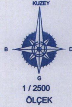
ITRF96 UTM 3 Derecelik Koordinatlar