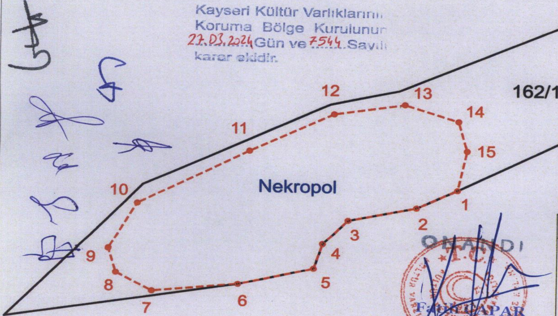
ITRF96 3 Derecelik Koordinatlar