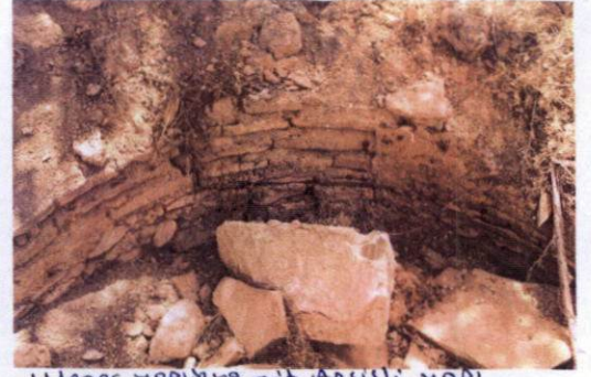
Mezar yapısına ait Apsisli yapı