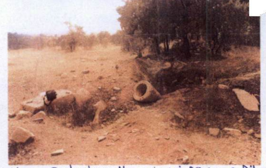
Kan Çukurları ile mineri parça ve diğer

T.C KÜLTÜR VE TURİZM BAKANLIĞI Kütahya Kültür Varlıklarını Koruma Bölge Kurulu Müdürlüğü