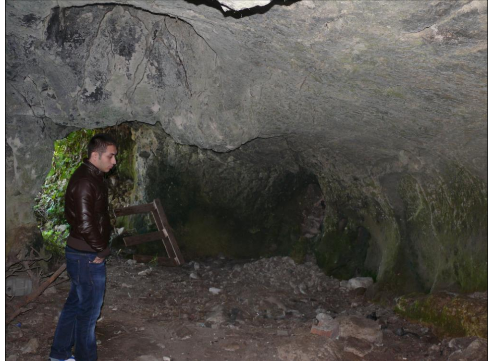
ARNAVUTKÖY İLÇESİ ÇİLİNGİR MAHALLESİ, 191 PARSELDE YER ALAN MAĞARADAN GÖRÜNÜM.