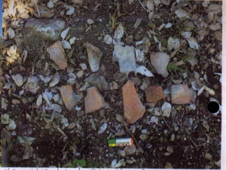
Bozkuş Köy Mezarlığı genel deaylar