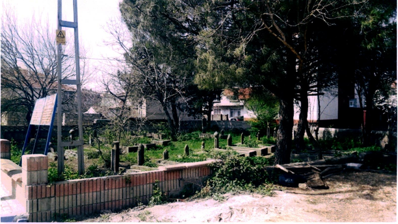
ETRAFI DUVARLA ÇEVRELİ MEZARLIK ALANININ YOL CEPHESİNDEN GÖRÜNÜMÜ