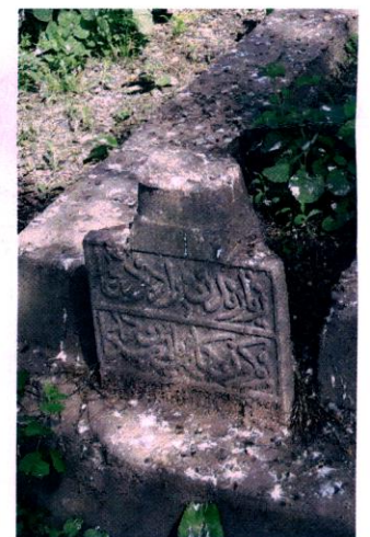
MEZAR TAŞLARINDAN GÖRÜNÜM