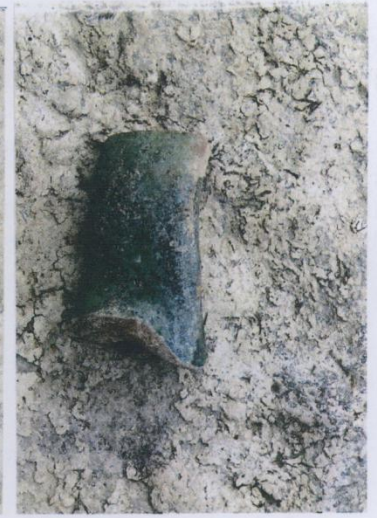
Alanda bulunan p.t.ç.ç parçaları