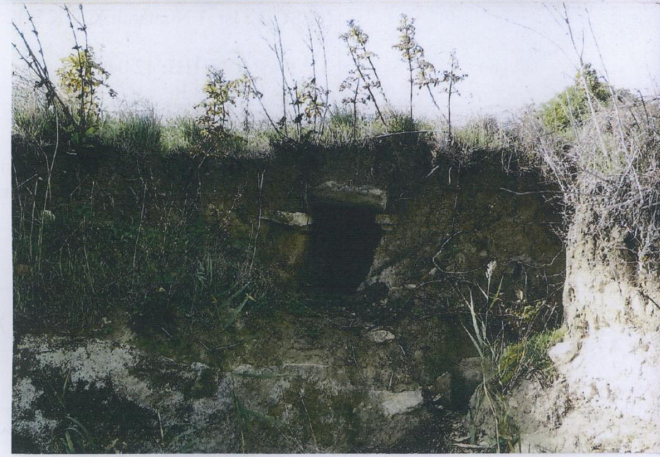
Doğu-Batı doğrultulu bir mezar