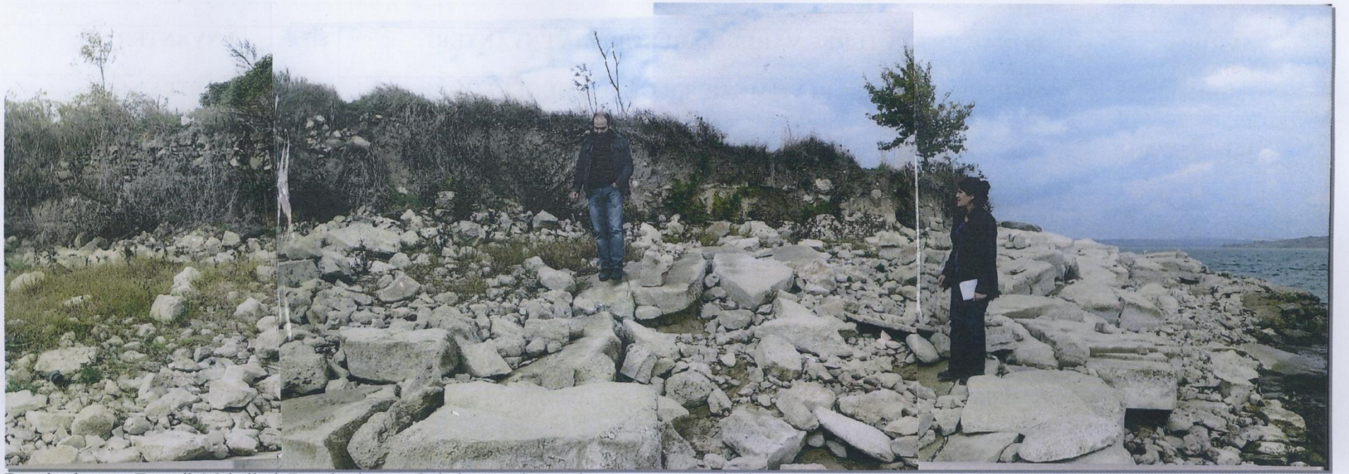
Büyükçekmece, Tepecik Mahallesi, Büyükçekmece Gölü kenarında yer alan yığma taş örgülü duvar ve duvara ait yapı taşları