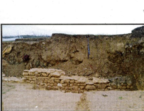
F20-plan karesindeki duvar kalıntısı

[Handwritten signature] [Handwritten signature] re.k