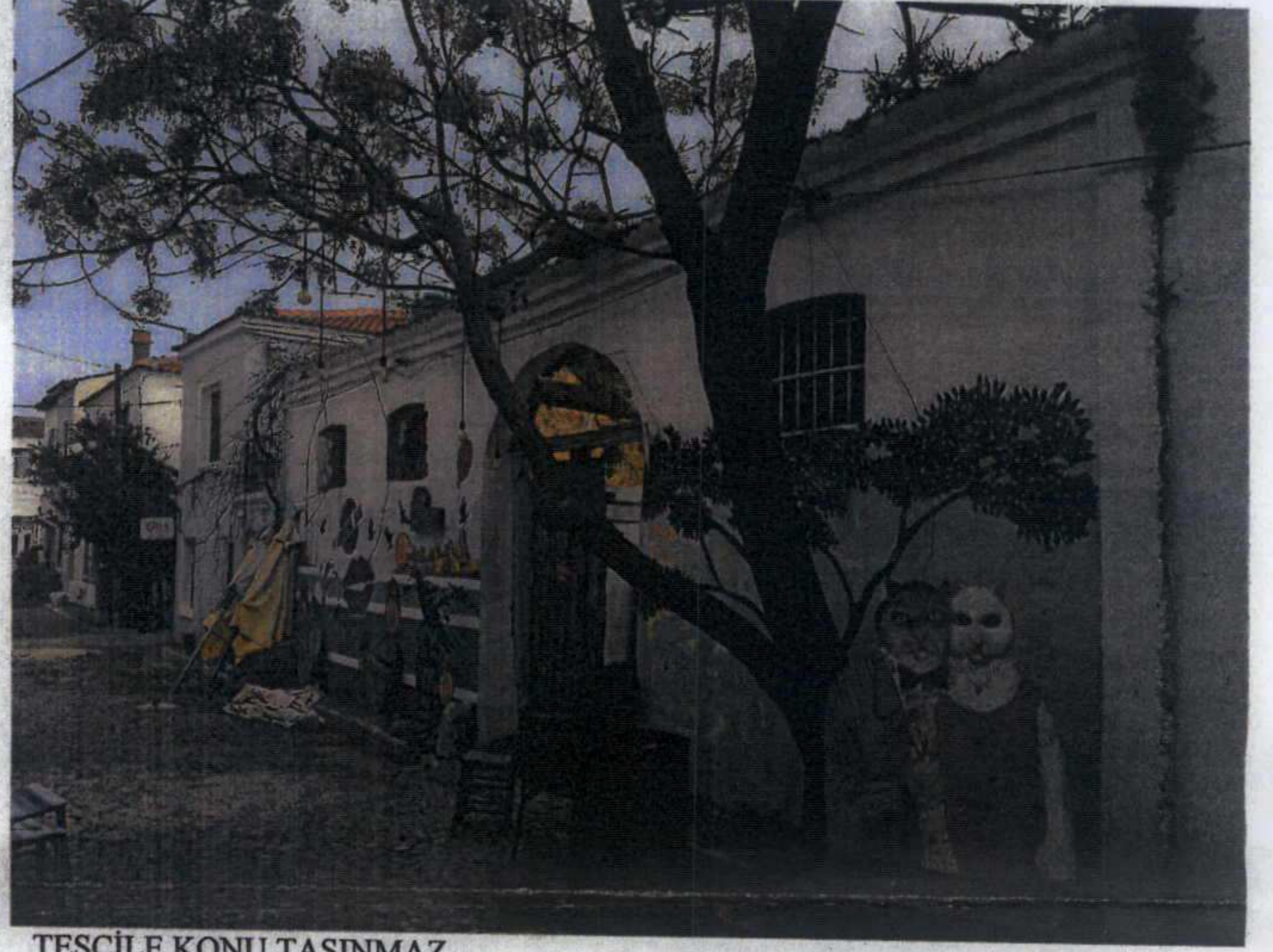
TESCİLE KONU TAŞINMAZ