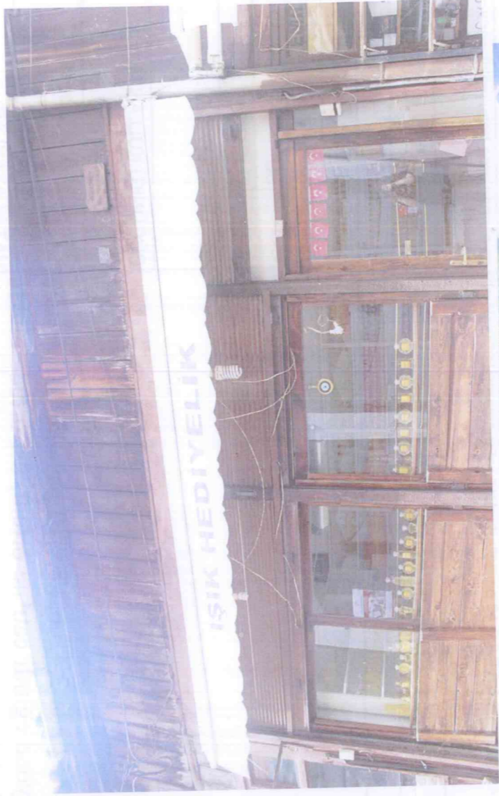
Emreçan Hediyelik, Işık Hediyelik, El Sanatları Cam Üfleme, Boş Hediyelik