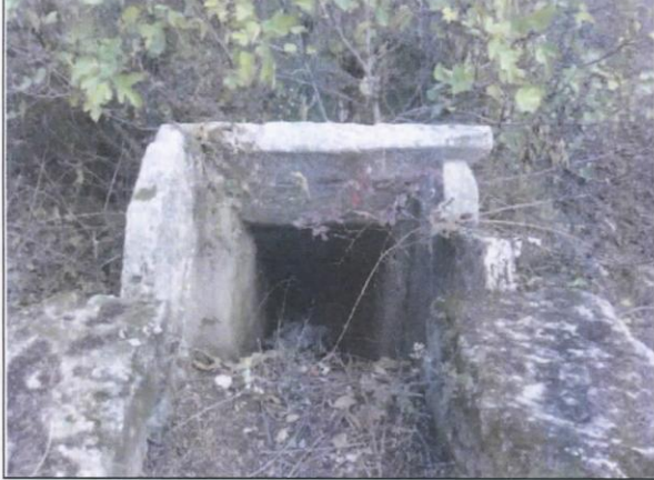
Resim-1: Giriş kısmı (2011)