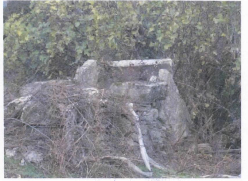
2011 yılına ait fotoğraflar

Handwritten signatures and initials in blue ink, including a large stylized signature and the text "re.k. - t.c.".