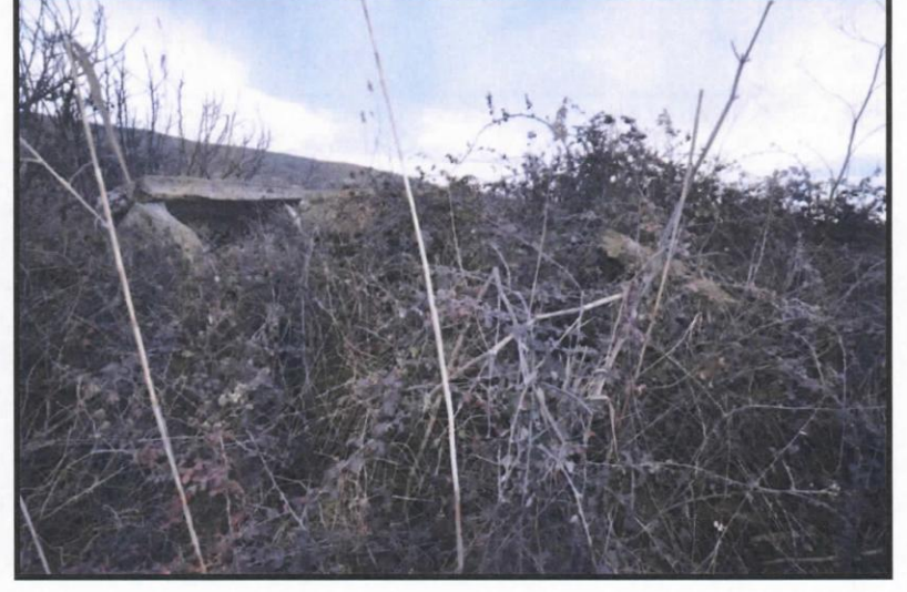
Açıklama: Kalıntıların ve çevresinin mevcut durumu (2019)