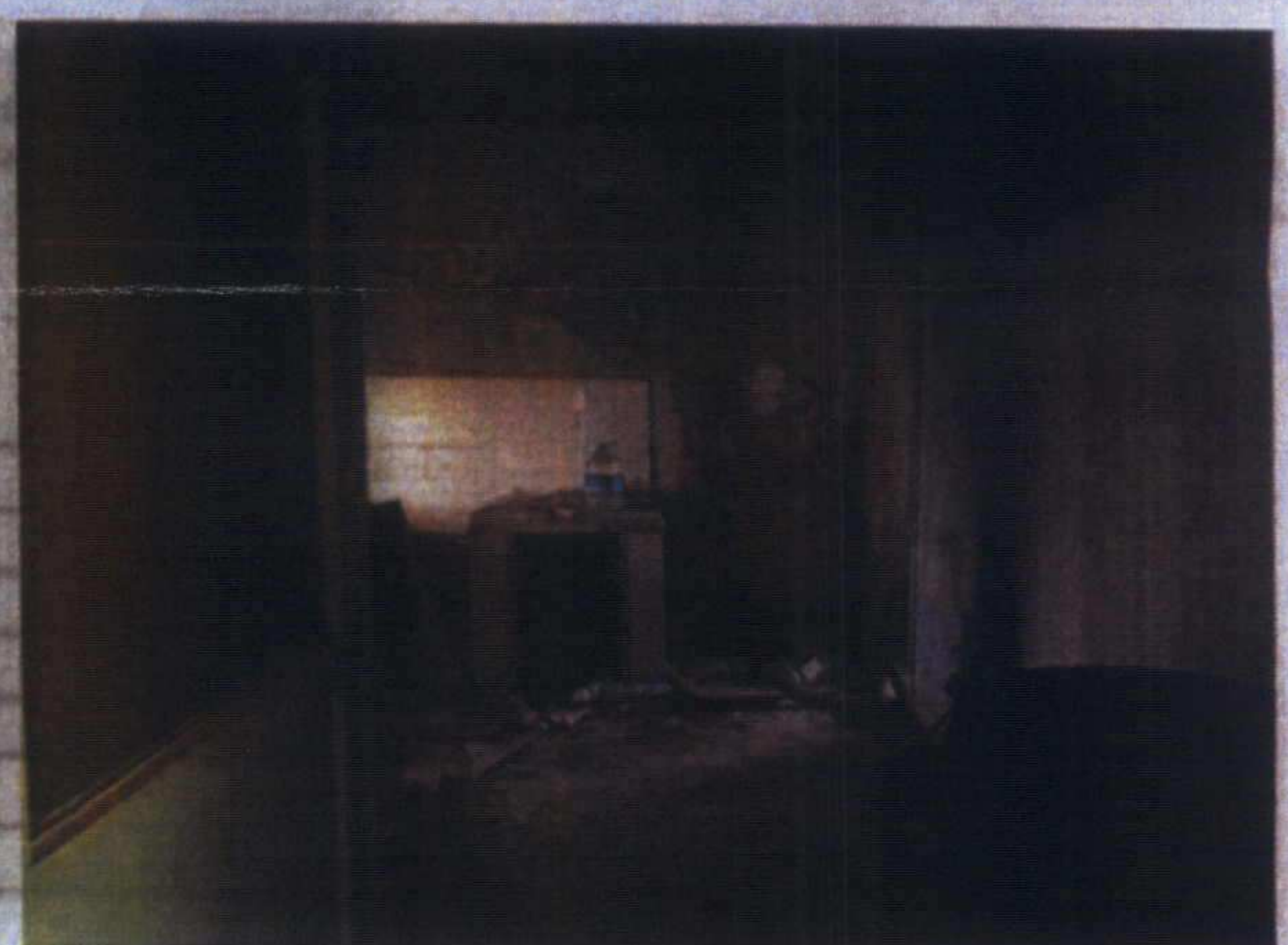
Gün ve ..... Sıyah karısı ©KIDK