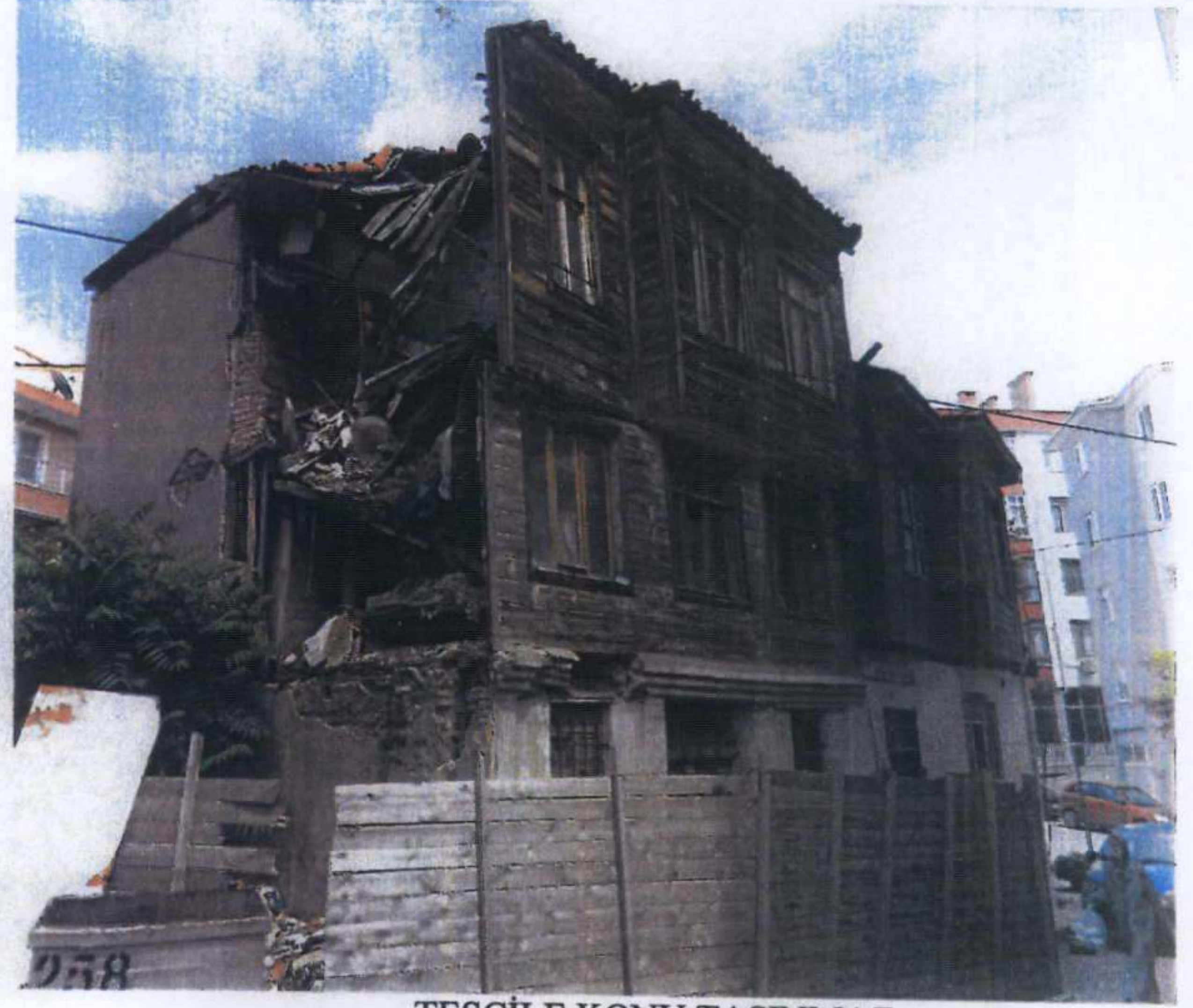
TESCİLE KONU TAŞINMAZ

GÖZLEMLER: Tescile konu yapı, Gelibolu İlçesi, Yazıcızade Mahallesi, son dönem Osmanlı ve Erken dönem Cumhuriyet döneminde inşa edilmiş yapılar arasında yer almakta ve üç katlıdır.