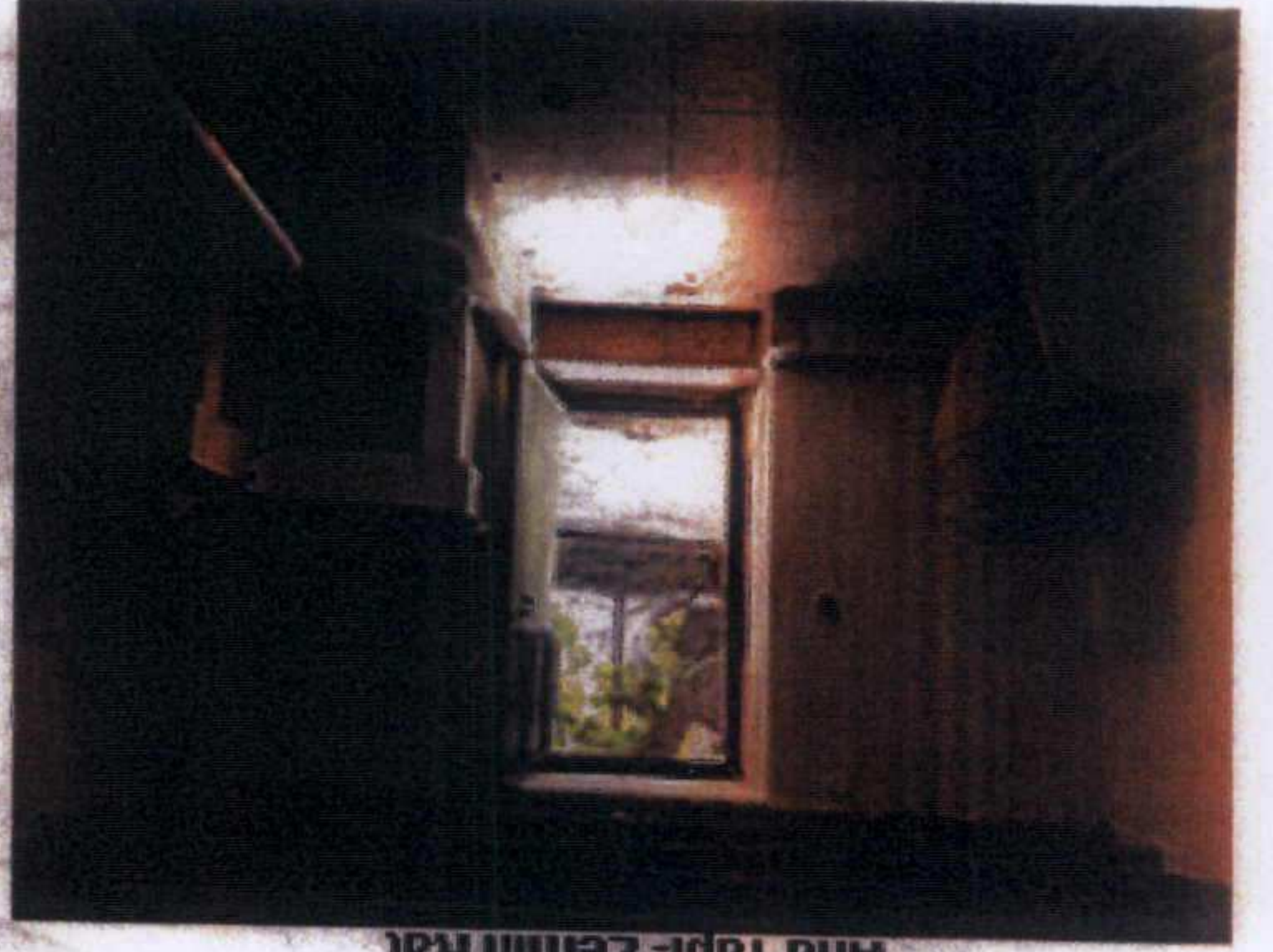
Ana Yapı-Zemin Kat