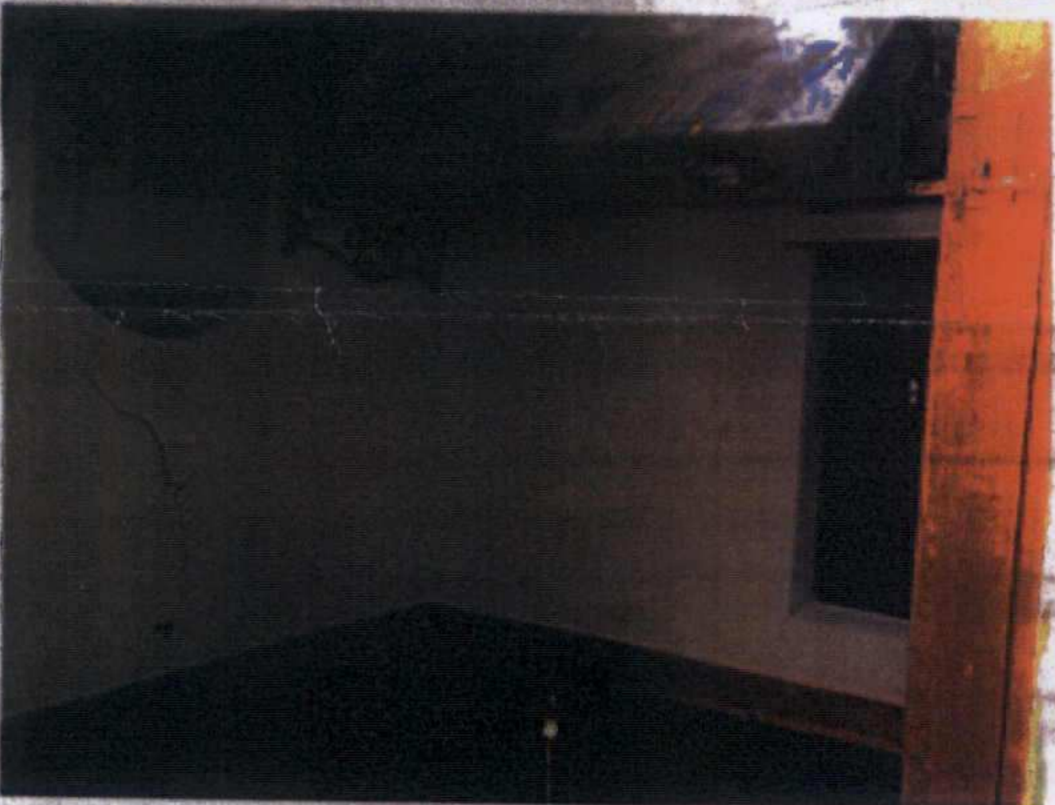
Ana Yapı-Üst Kat