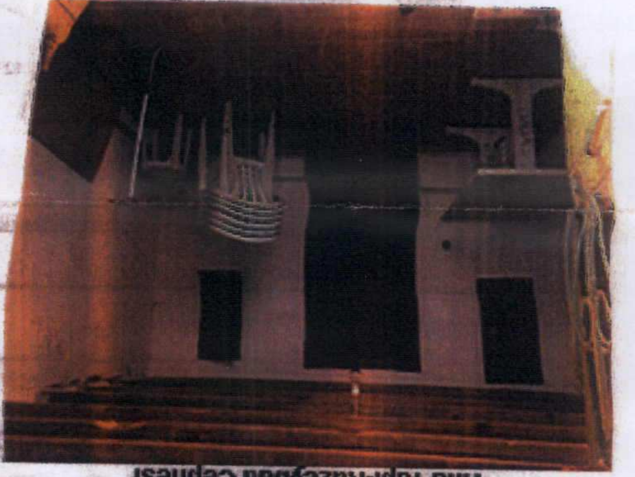
Ana Yapı-Kuzeybatı Cephesi