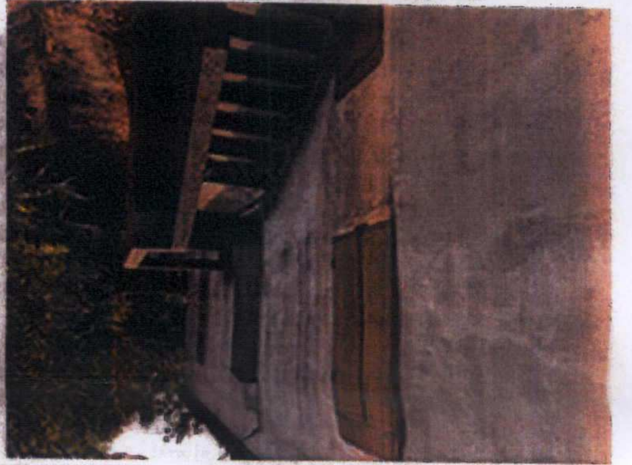
Ana Yapı-Zemin Kat Girişi