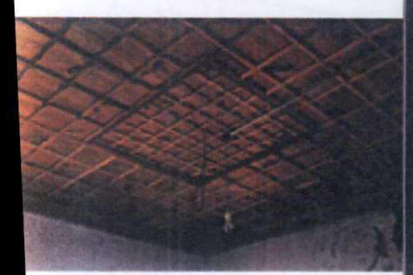
TEK KATLI DAM YAPILARI, OCAK VE WC