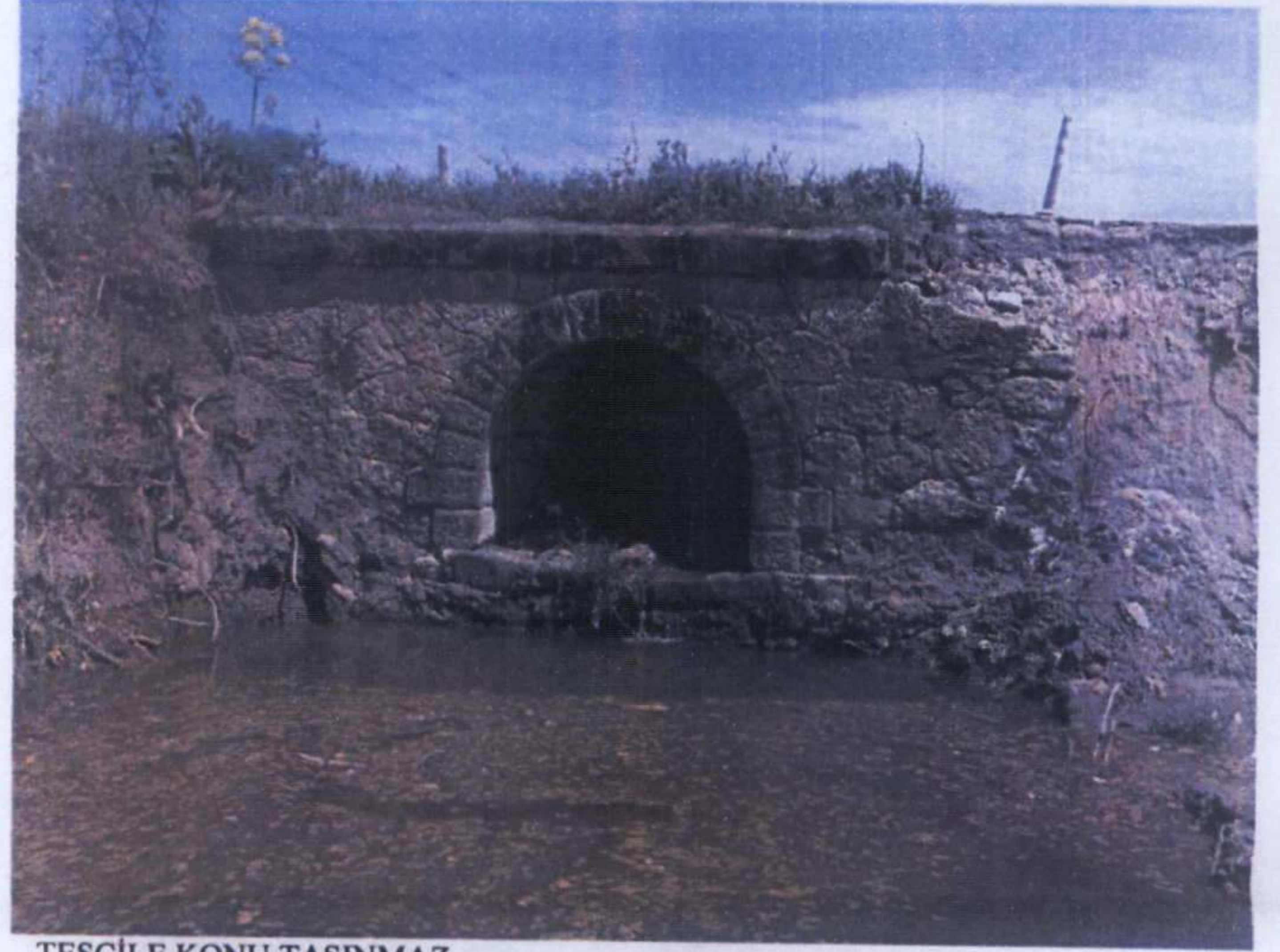
TESCİLE KONU TAŞINMAZ

GÖZLEMLER: Menfezin Karabiga Beldesi yönü, sol bölümü toprak altında iken, sağ bölümü açıkta olup, üst bölümdeki kısmi bozulma dışında oldukça sağlamdır.