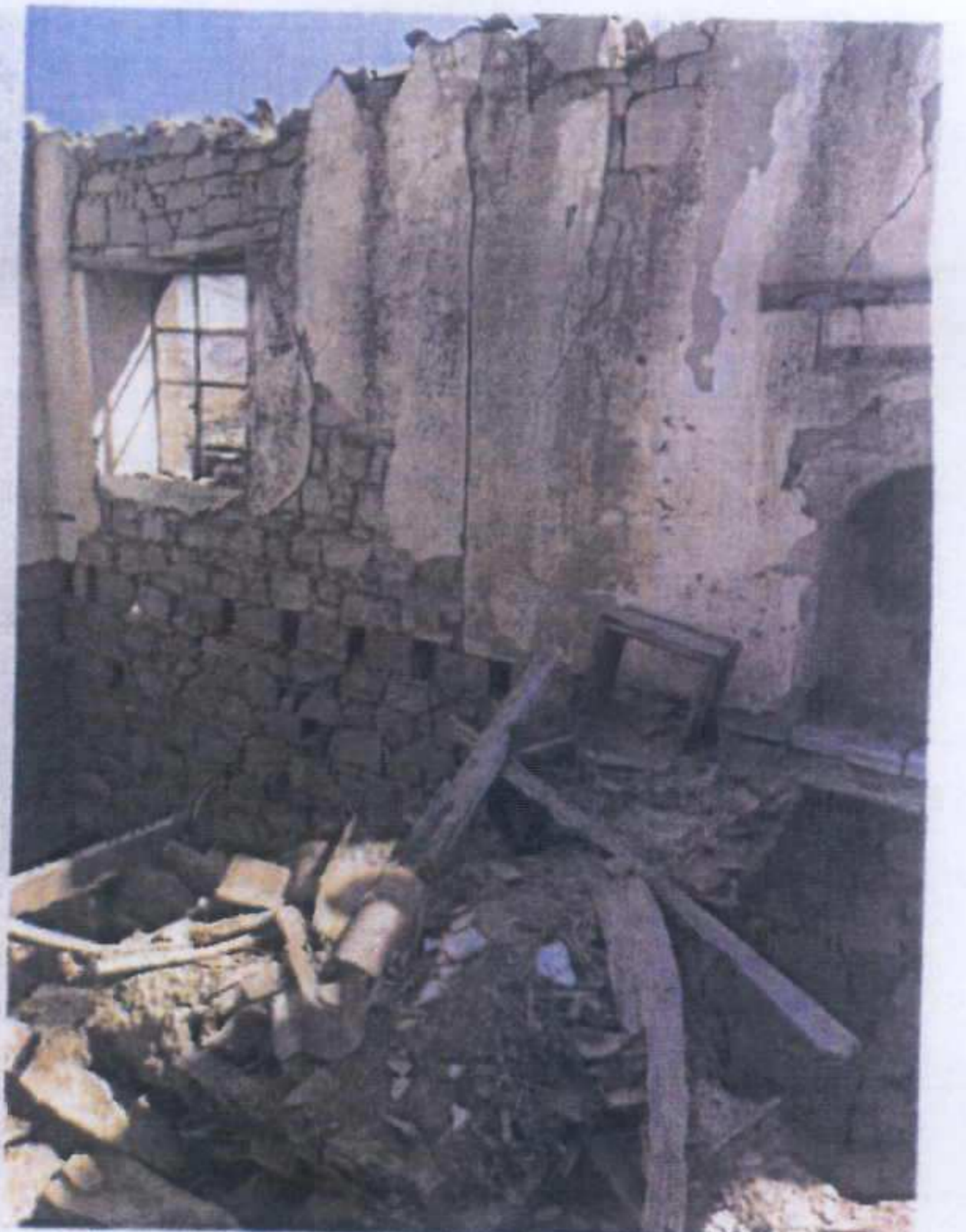
AÇIK GİBİDİR E. Çakır / 2010 Koruma Bölge Müdürü