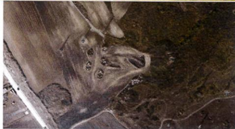
2013 Hava Fotoğrafi