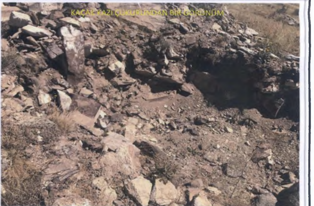
KAÇAK KAZI ÇUKURUNDAN BİR GÖRÜNÜM