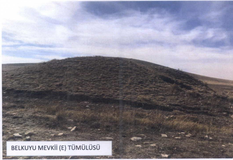
BELKUYU MEVKİİ (E) TÜMÜLÜSÜ