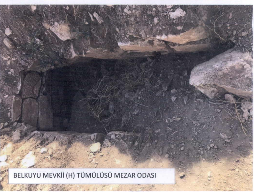
BELKUYU MEVKİİ (H) TÜMÜLÜSÜ MEZAR ODASI