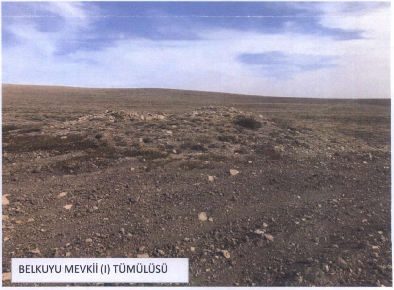
BELKUYU MEVKİİ (I) TÜMÜLÜSÜ