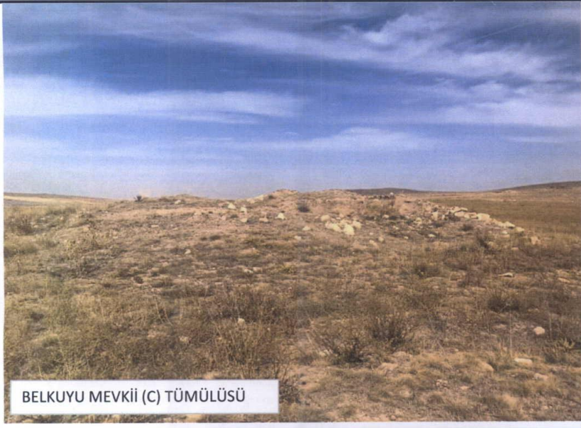
BELKUYU MEVKİİ (C) TÜMÜLÜSÜ