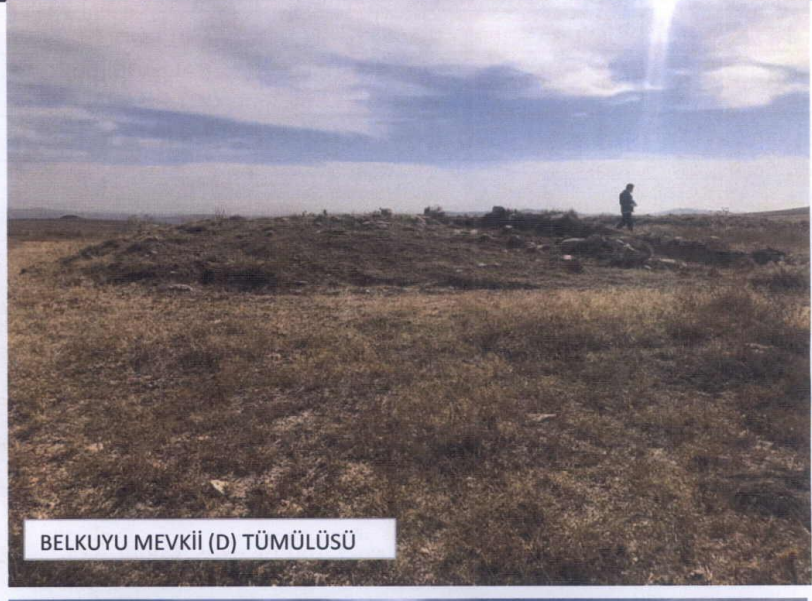
BELKUYU MEVKİİ (D) TÜMÜLÜSÜ