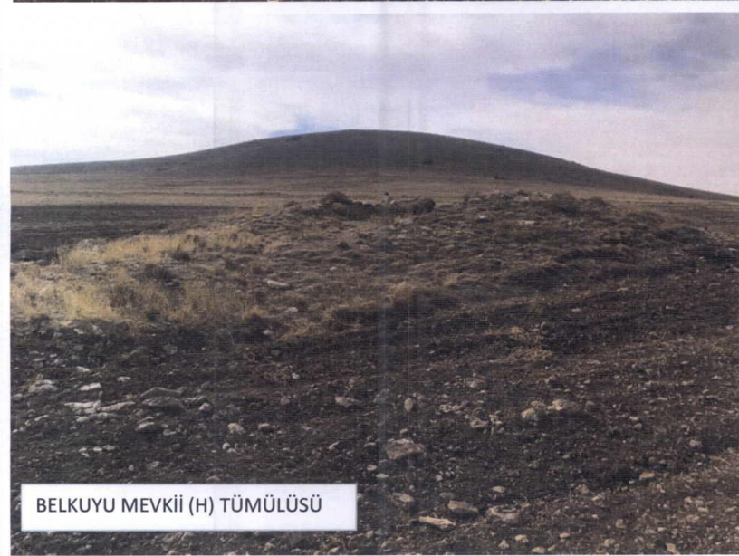
BELKUYU MEVKİİ (H) TÜMÜLÜSÜ