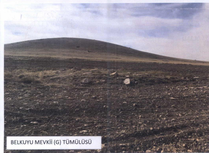
BELKUYU MEVKİİ (G) TÜMÜLÜSÜ