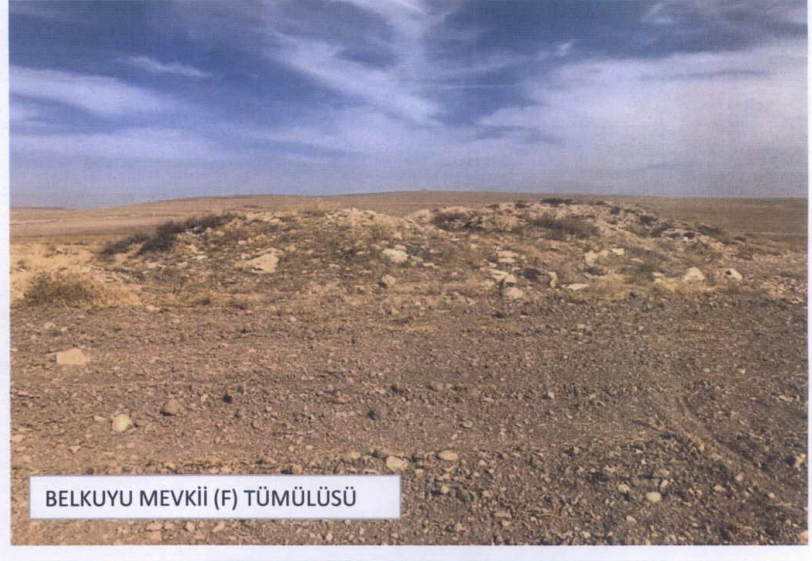
BELKUYU MEVKİİ (F) TÜMÜLÜSÜ