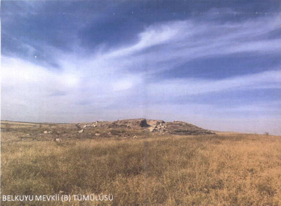
BELKUYU MEVKİİ (B) TÜMÜLÜSÜ