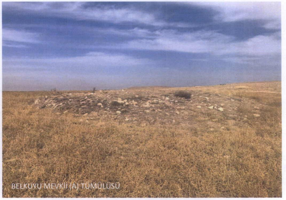
BELKUYU MEVKİİ (A) TÜMÜLÜSÜ