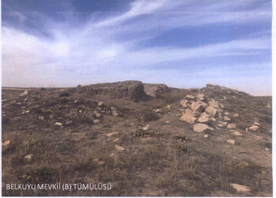
BELKUYU MEVKİİ (B) TÜMÜLÜSÜ