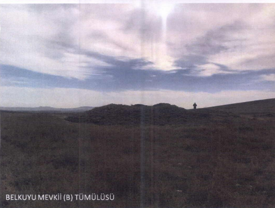
BELKUYU MEVKİİ (B) TÜMÜLÜSÜ