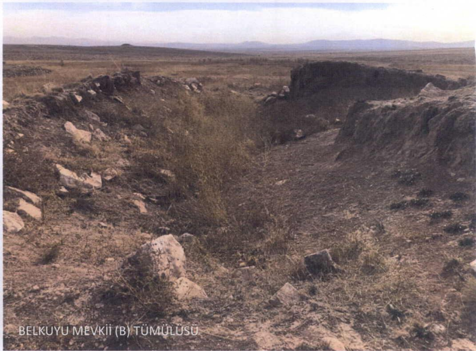
BELKUYU MEVKİİ (B) TÜMÜLÜSÜ