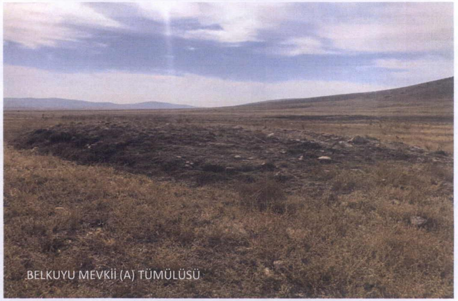
BELKUYU MEVKİİ (A) TÜMÜLÜSÜ