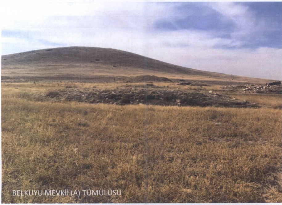
BELKUYU MEVKİİ (A) TÜMÜLÜSÜ