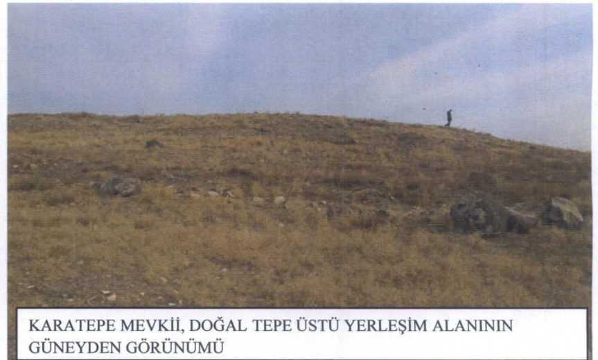
KARATEPE MEVKİİ, DOĞAL TEPE ÜSTÜ YERLEŞİM ALANININ GÜNEYDEN GÖRÜNÜMÜ