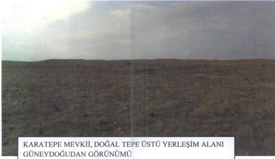
KARATEPE MEVKİİ, DOĞAL TEPE ÜSTÜ YERLEŞİM ALANI GÜNEYDOĞUDAN GÖRÜNÜMÜ