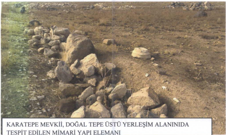
KARATEPE MEVKİİ, DOĞAL TEPE ÜSTÜ YERLEŞİM ALANINIDA TESPİT EDİLEN MİMARİ YAPI ELEMANI