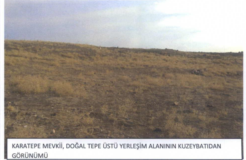
KARATEPE MEVKİİ, DOĞAL TEPE ÜSTÜ YERLEŞİM ALANININ KUZEBATIDAN GÖRÜNÜMÜ