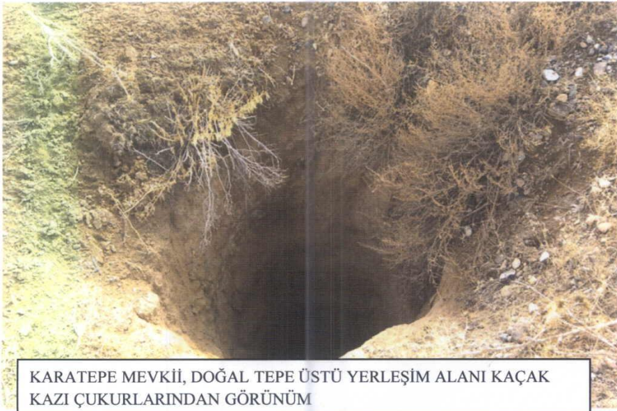
KARATEPE MEVKİİ, DOĞAL TEPE ÜSTÜ YERLEŞİM ALANI KAÇAK KAZI ÇUKURLARINDAN GÖRÜNÜM