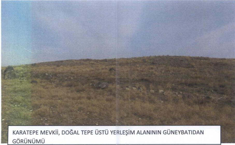
KARATEPE MEVKİİ, DOĞAL TEPE ÜSTÜ YERLEŞİM ALANININ GÜNEYBATIDAN GÖRÜNÜMÜ