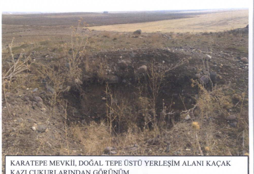
KARATEPE MEVKİİ, DOĞAL TEPE ÜSTÜ YERLEŞİM ALANI KAÇAK KAZI ÇUKURLARINDAN GÖRÜNÜM