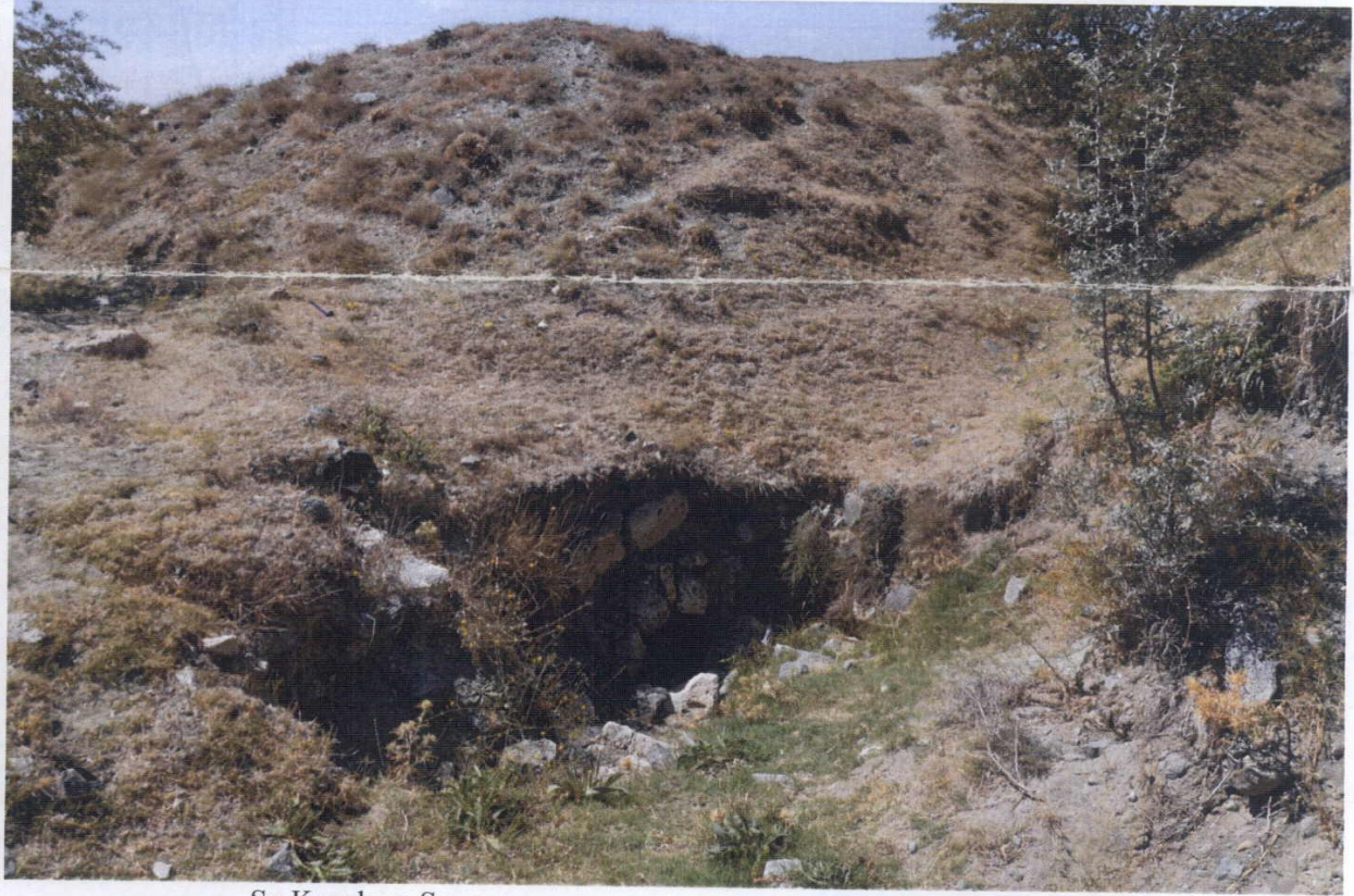
Su Kanalı ve Sarnıç