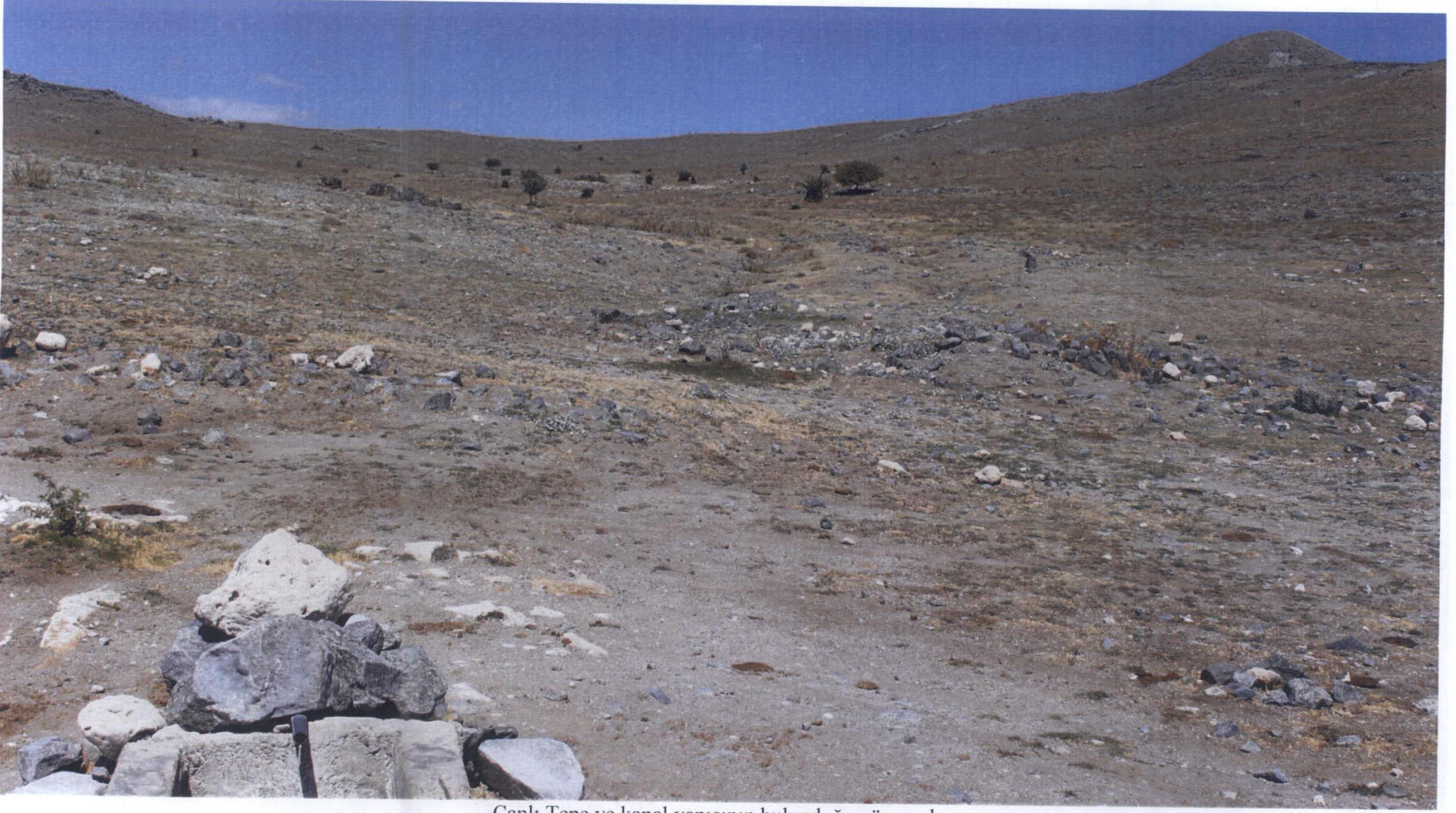
Çanlı Tepe ve kanal yapısının bulunduğu güzergah