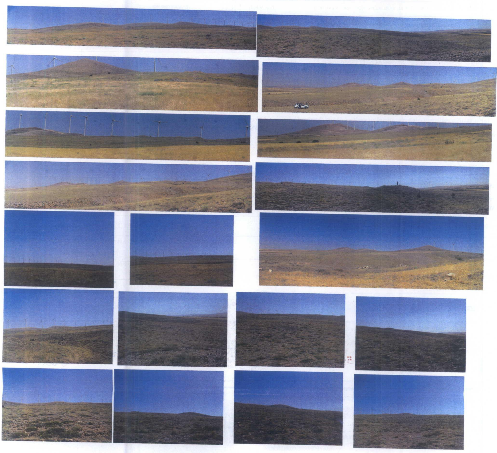
OBRUK NEKROPOLÜ I-II