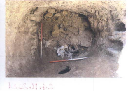
3 nolu kaya oyma mekan