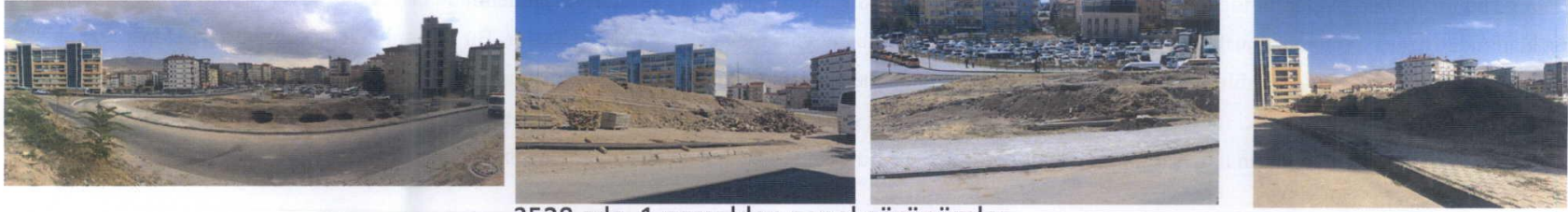
3528 ada, 1 parselden genel görünüm