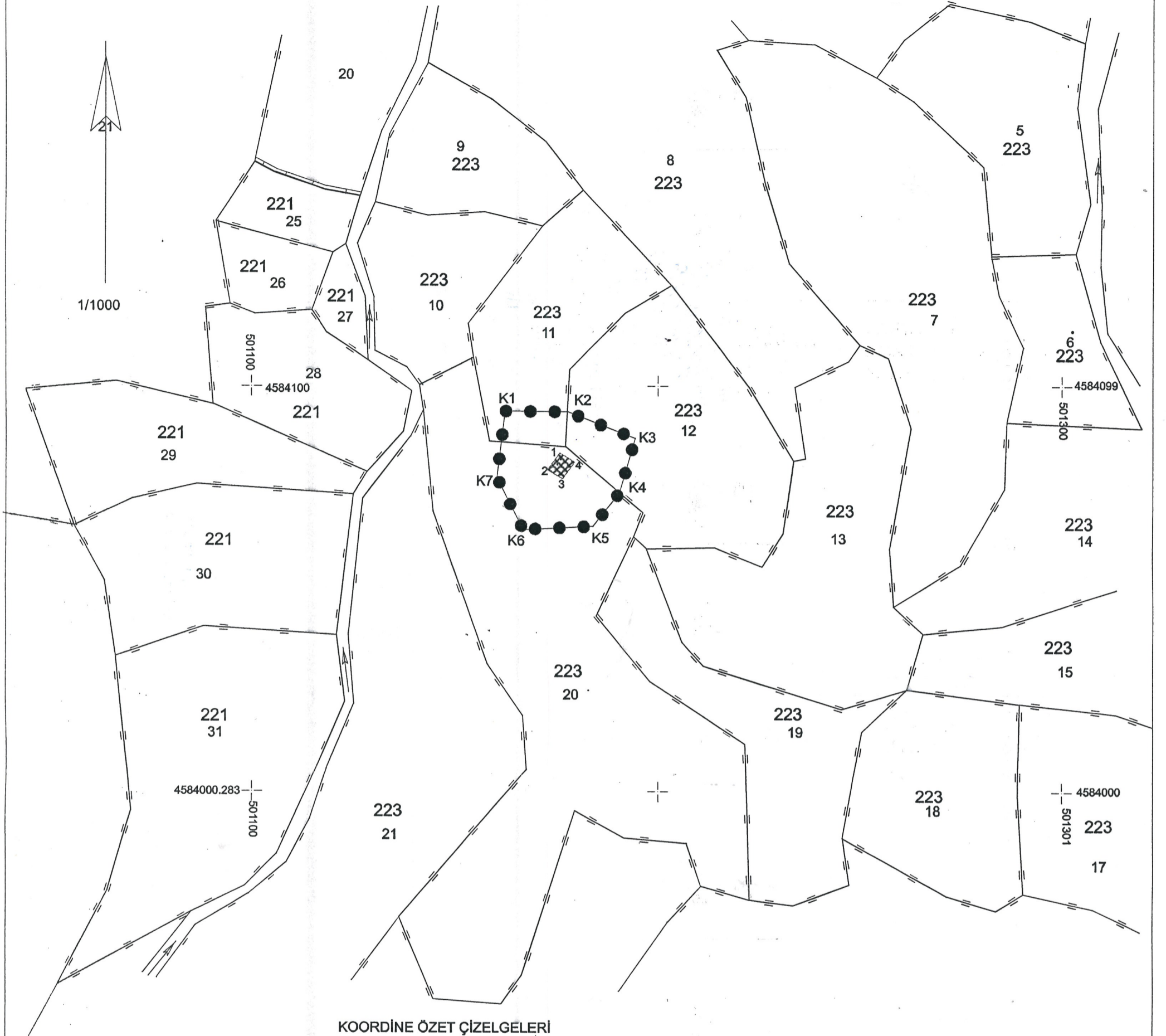
KOORDİNE ÖZET ÇİZELGELERİ