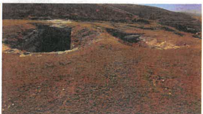
ITRF 3-42 KOOR.