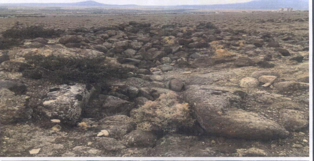
TAŞKIRLI MEVKİİ YIĞMA MEZAR (C)