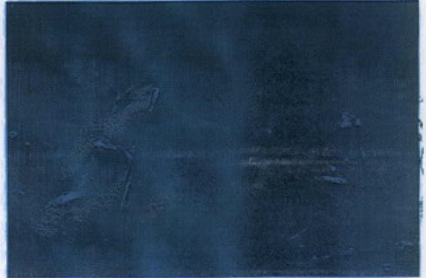
Fot. 5. Kazı alanının kapatma öncesi görünüm