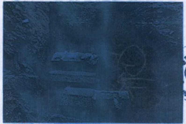
Fot. 2: L1, L2 ve L3 mezarlarının kazı sırasında kuzeyden görünümü,