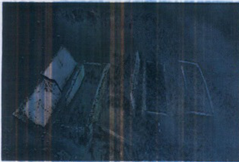
Fot. 3. Lahitlerin kazı sonrası genel görünümü,