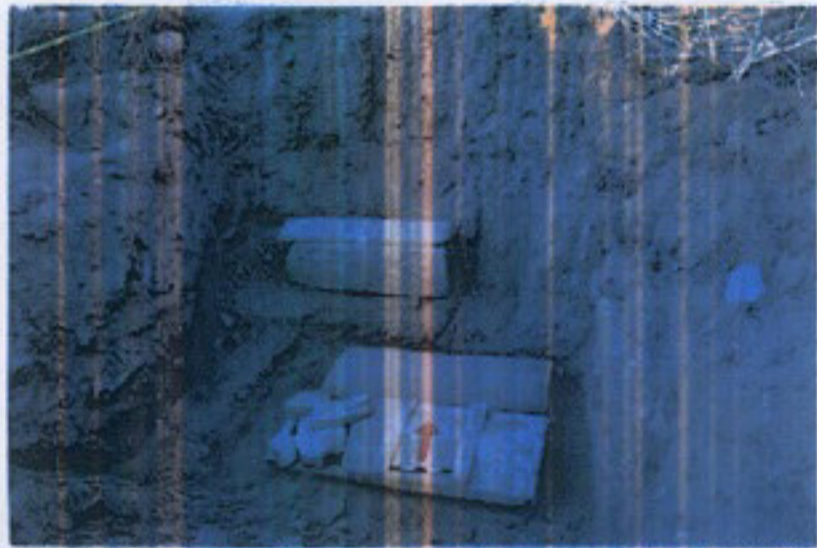
Fot. 1: L1, L2 ve L3 mezarlarının kazı sırasında görünümü