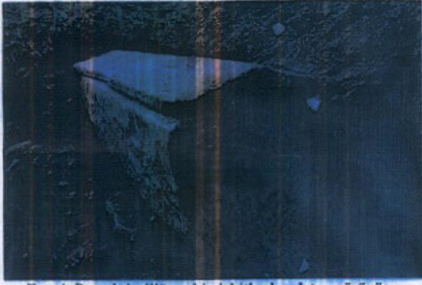
Fot. 4. Parçalı işçiliğe sahip lahitlerden detay görünüm,