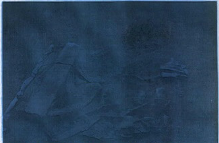
Fot. 6. Kazı alanının jeotekstil örtü ile kapatılması,