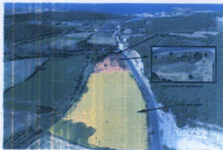
187 ve 188 Nolu Parsellerin Hava Fotoğrafı

Çanakkale İli, Biga İlçesi, Kemer Köyü'nde, 187-188 Parsel Numaralı Taşınmazlarda Yer Alan Eğrek Başı Mevkil Nekropolü