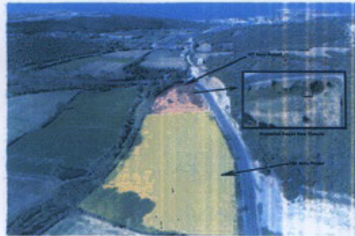
187 ve 188 Nolu Parsellerin Hava Fotoğrafi

Çanakkale KVKBK'nun 22.05.2022 Gün ve 7911 Sayılı karar ekidir.